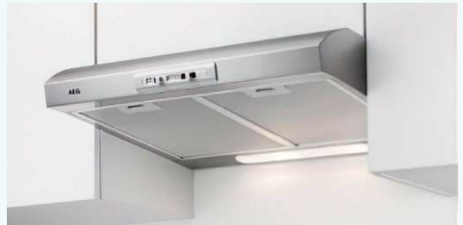
Dampkap met metalen filter

Vet, stoom en rook kunnen zich ook gemakkelijk op de buitenkant van de dampkap ophopen en de goede werking van de bedieningsknoppen belemmeren.