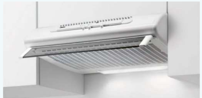
Dampkap met filterdoek