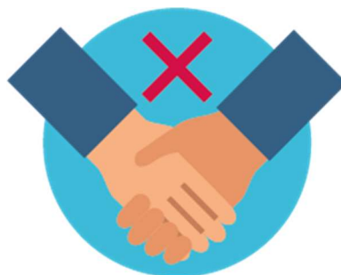
GEEN HANDEN SCHUDDEN