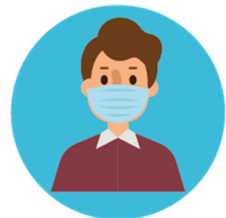
DRAAG EEN MONDMASKER